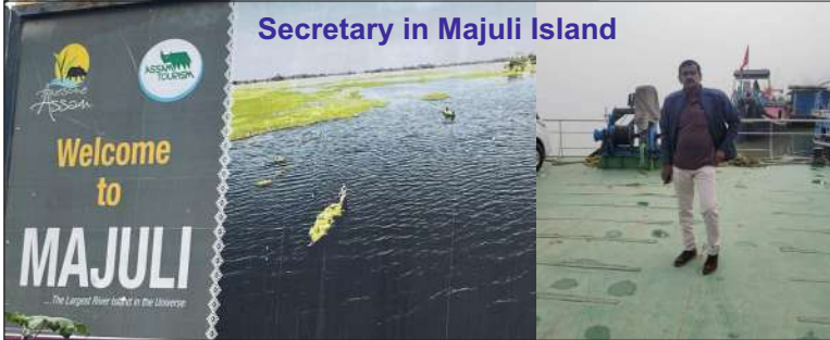
Secretary in Majuli Island